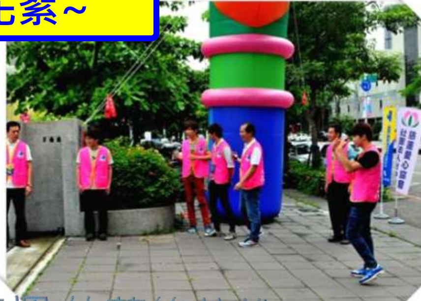
豔陽下戶外辛苦指揮的幕後英雄